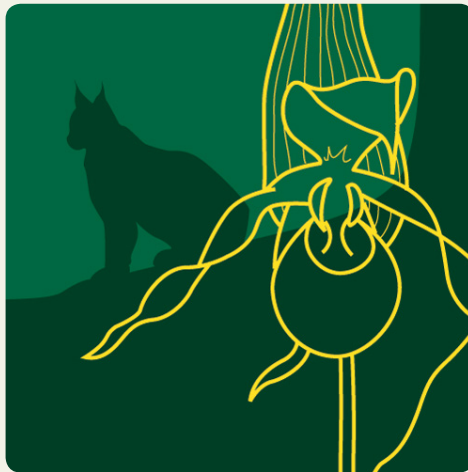
Illustration: Tobias Flyger